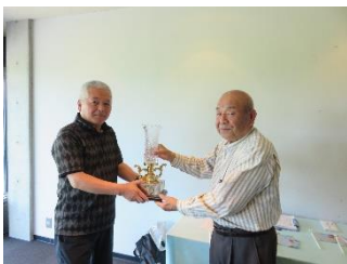
第17回親睦ゴルフコンペ