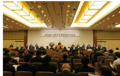
全国浄化槽技術研究集会 (R1.10.9～10 秋田県)