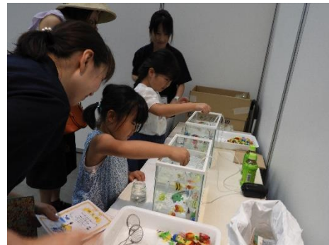
サンメッセかがわ (R1.8.4 高松市)