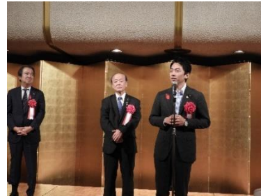
第33回全国浄化槽大会(R1.10.1 東京都)