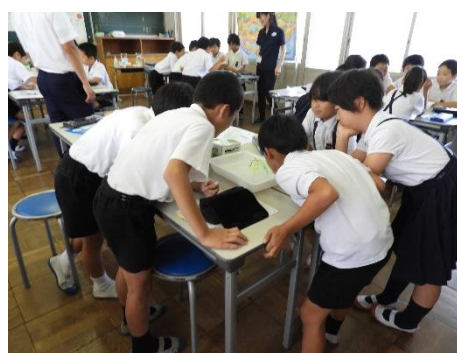
善通寺市立中央小学校（R1.6.28 善通寺市）