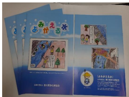
環境学習テキスト「よみがえる水」