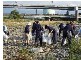
環境美化活動(R1.6.13 香東川左岸)

○香川県との「災害時における浄化槽の復旧支援活動に関する協定」に基づき災害廃棄物処理広域訓練に参加し、全浄連四国地区5団体が「災害時における相互応援協定」を締結し、東南海・南海地震等の大災害に備えた。