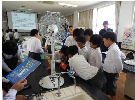
さぬき市立さぬき南小学校 (R1.10.10 さぬき市)