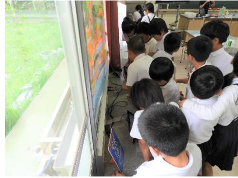
三木町立白山小学校 (R1.7.3 三木町)