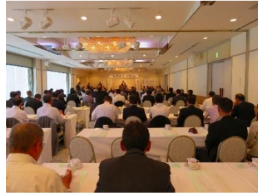
第7回定時総会 (R1.6.26 東京都)