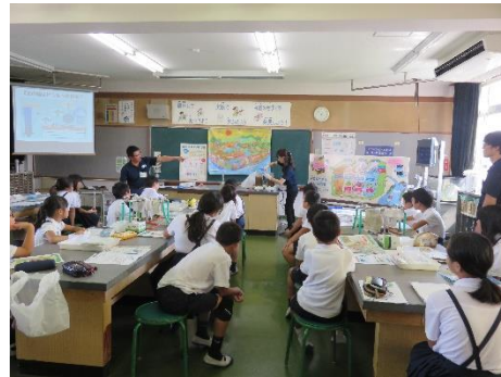
高松市立屋島東小学校 (R1.10.1)