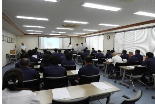
検査員研修(R1.11.15 協会会議室)