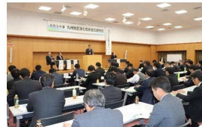
九州地区浄化槽検査員研修会 (R1.11.15 大分県)