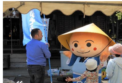
神社でライブ in 白峰宮 (R1.5.5 坂出市)