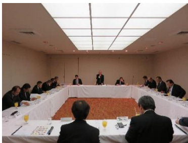
全浄連四国地区協議会・浄化槽法指定検査機関四国地区協議会 2019年度総会(H31.4.24 高松国際ホテル)