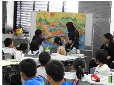
瓦町 FLAG (R1.7.31~8.1 高松市)