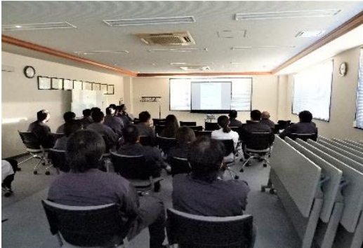
検査職員研修 (R1.8.22 協会会議室)

検査の信頼性確保のため、水質検査のpH等4項目について内部精度管理を実施するとともに、香川県計量協会主催の分析講習会等外部精度管理事業に参加して検査の信頼性確保に努めた。また、検査職員の知識と技能を高めるため、メーカーによる新機種浄化槽の構造、機能等についての説明会等、定期的に職員研修を実施した。