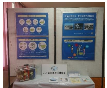
まんのう町琴南地区文化祭 (R1.11.3)

パネル等の広報資材を活用して、まんのう町琴南地区文化祭において、浄化槽の維持管理について広報啓発を行った。