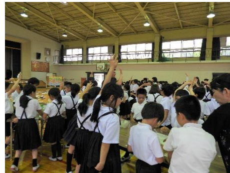
高松市立中央小学校 (R1.6.14)