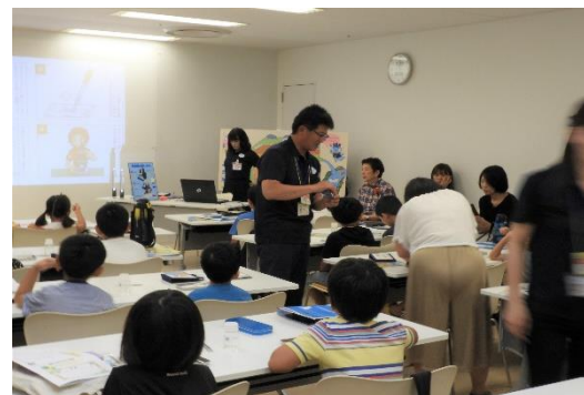
高松市環境学習 (出前) 講座 瓦町 FLAG (R1.8.9 高松市)