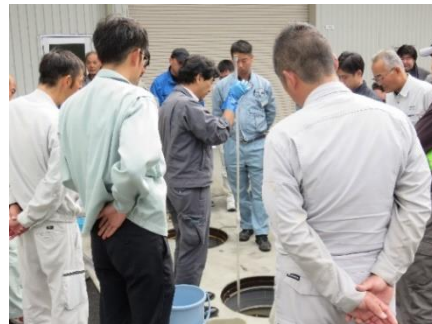
現場研修会(R1.10.29 観音寺)