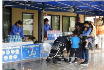
善通寺農商工夢フェスタ 2019 (R1.10.19~20 善通寺市)