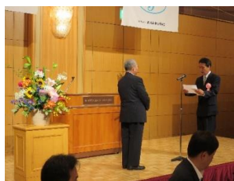
優良従業員表彰 (R1.5.28 第9回定時総会)