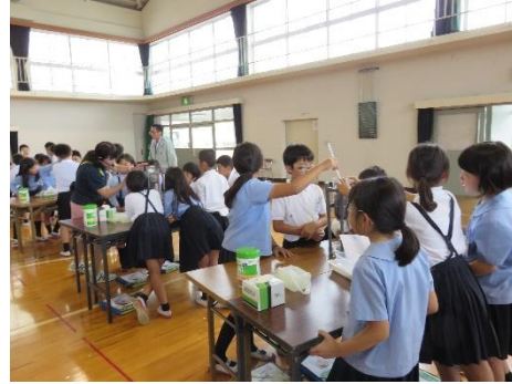
高松市立川添小学校 (R1.5.29)