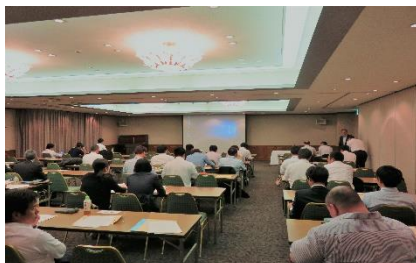
四国地区協議会浄化槽検査員研修会 (R1.9.19～20 高知県)